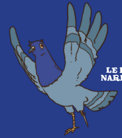
LE PIGEON NARRATEUR