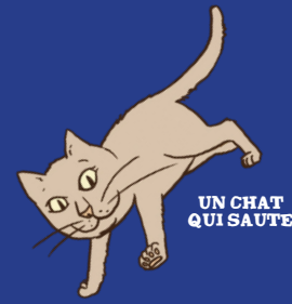
UN CHAT QUI SAUTE